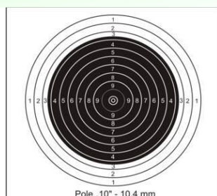
Tarcza karabin dowolny Kdw 50 m.

Karabin dowolny 10 strz. odległość strzelania 25 m.